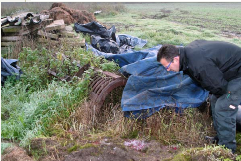
Geheel boven: zwarte rat Onder: speuren naar sporen van muizen en bruine ratten op rommelige plaatsen Rechts midden: jonge steenuil Rechts onder: schuil/ lokaaskistje voor buitengebruik met plaats voor drie klemmen